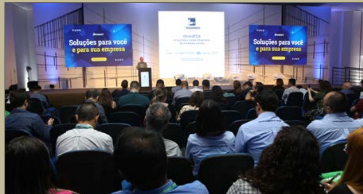
17º Simpósio Sincomavi O evento faz parte da programação oficial da Feicon