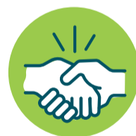
Toque ou aperto de mãos