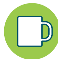
Objetos ou superfícies contaminadas